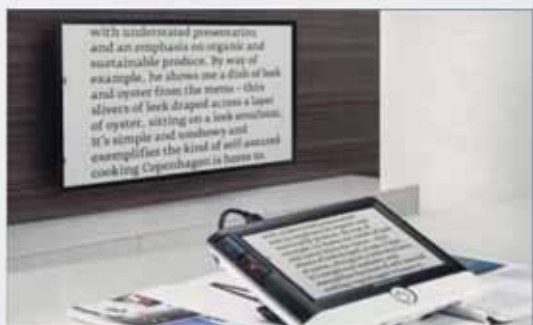
Porta HDMI per la trasmissione di immagini in tempo reale sul televisore (funzione doppio schermo: display e TV)