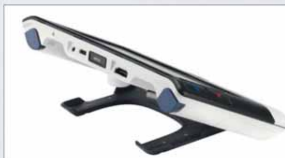
Porta USB 3.1 (tipo C) per la trasmissione di immagini su un computer (PC e Mac)