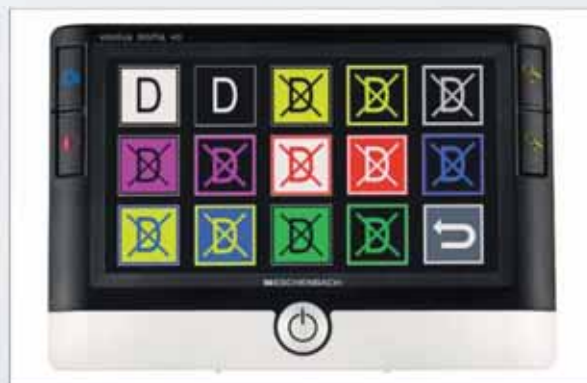
14 modalità di visualizzazione per il miglioramento individuale del contrasto